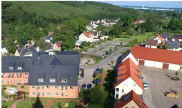
Blick vom Kirchturm

Diakonie heißt Dienst am Nächsten. Gott hat uns in den Dienst für pflegebedürftige alte Menschen gestellt. Er ist unser Auftraggeber und Begleiter. Wir möchten Gottes Liebe weitergeben. Das Urbanushaus ist nach einem römischen Diakon benannt. Die Evangelisch-Lutherische Gemeinde in Thurm heißt St. Urban-Kirchgemeinde.