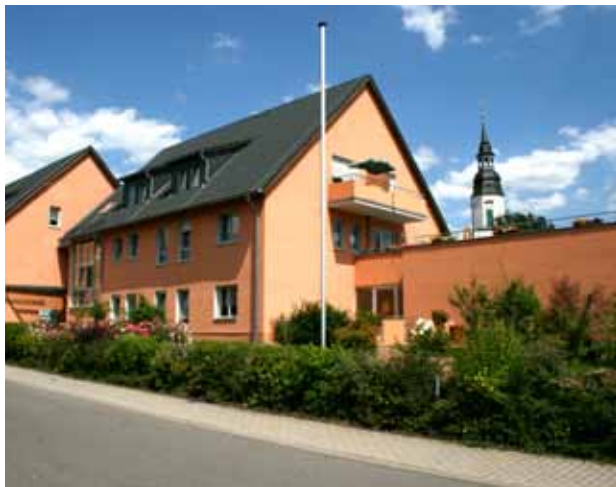
Blick zur Kirche